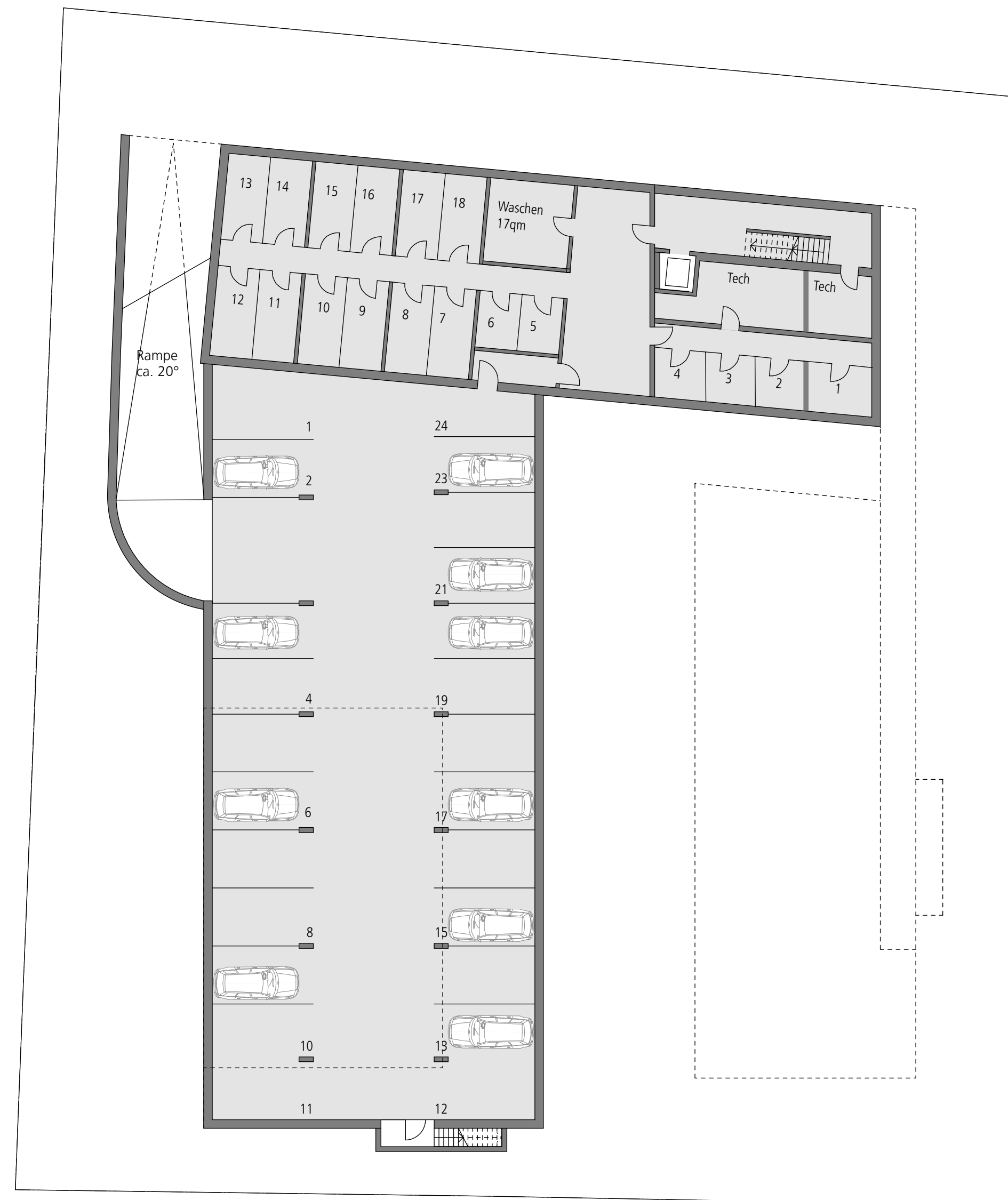
GRUNDRISS UNTERGESCHOSS M 1:200