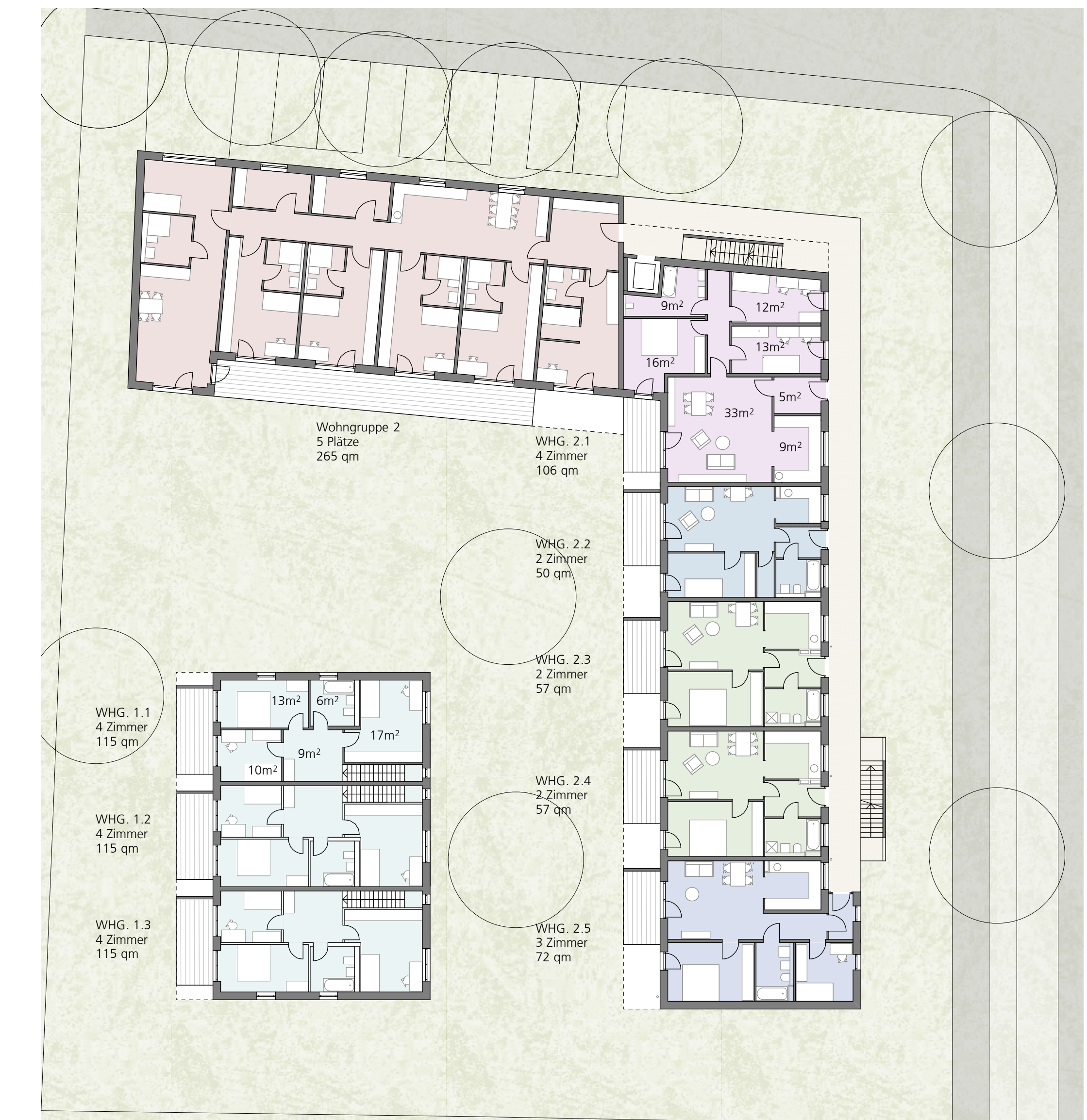
GRUNDRISS 1. OBERGESCHOSS M 1:200