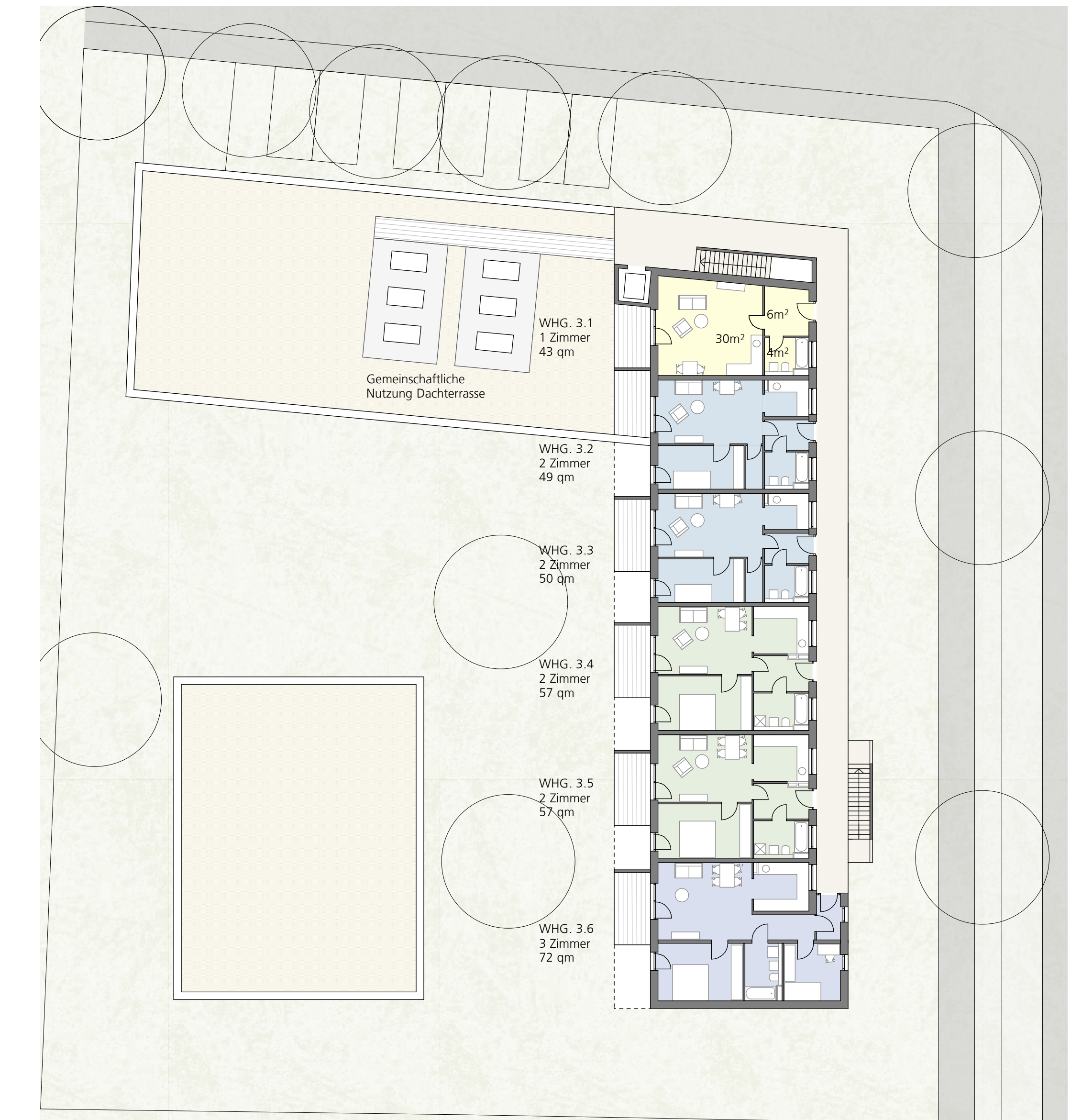
GRUNDRISS 2. OBERGESCHOSS M 1:200