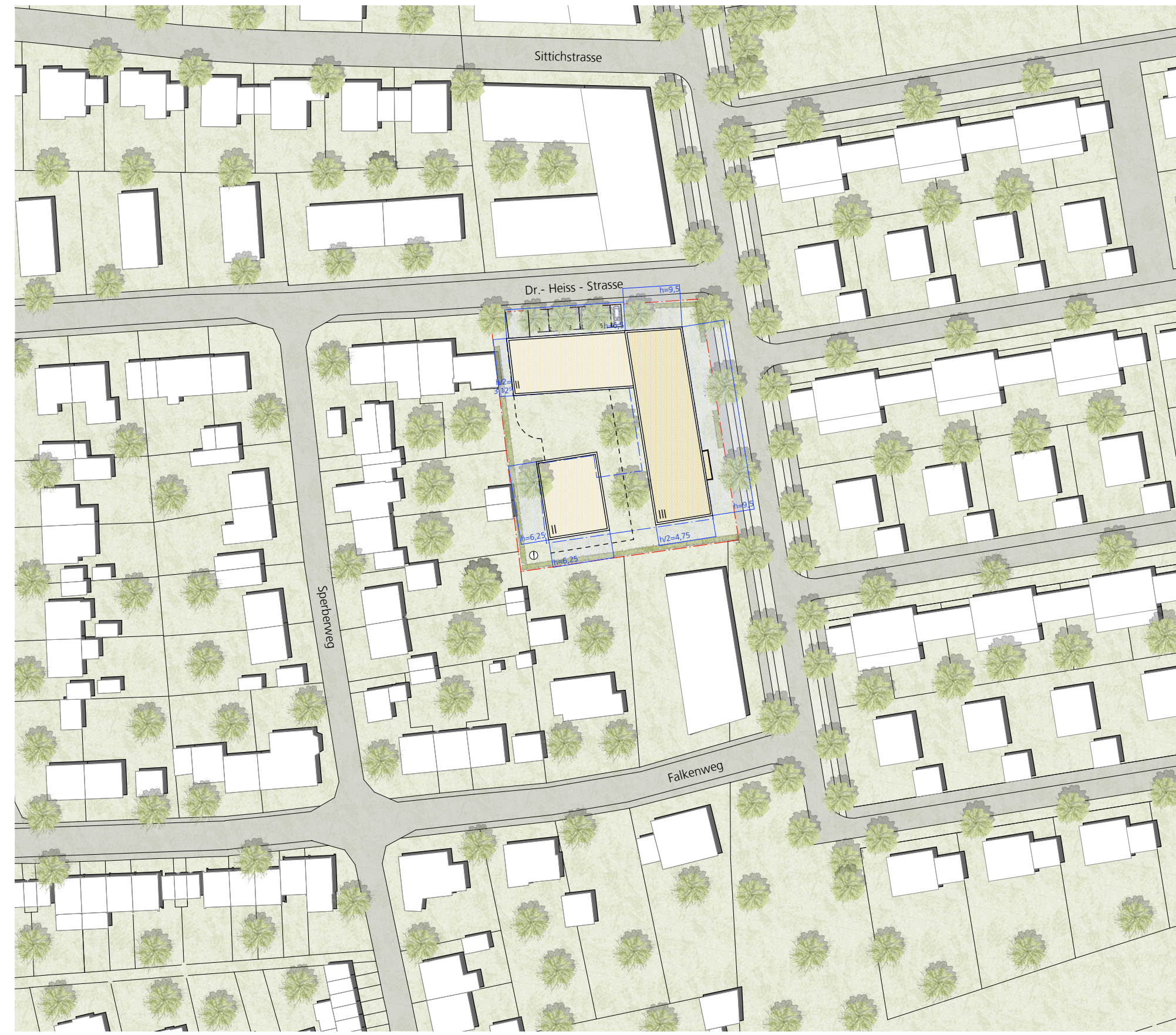
LAGEPLAN M 1:1000