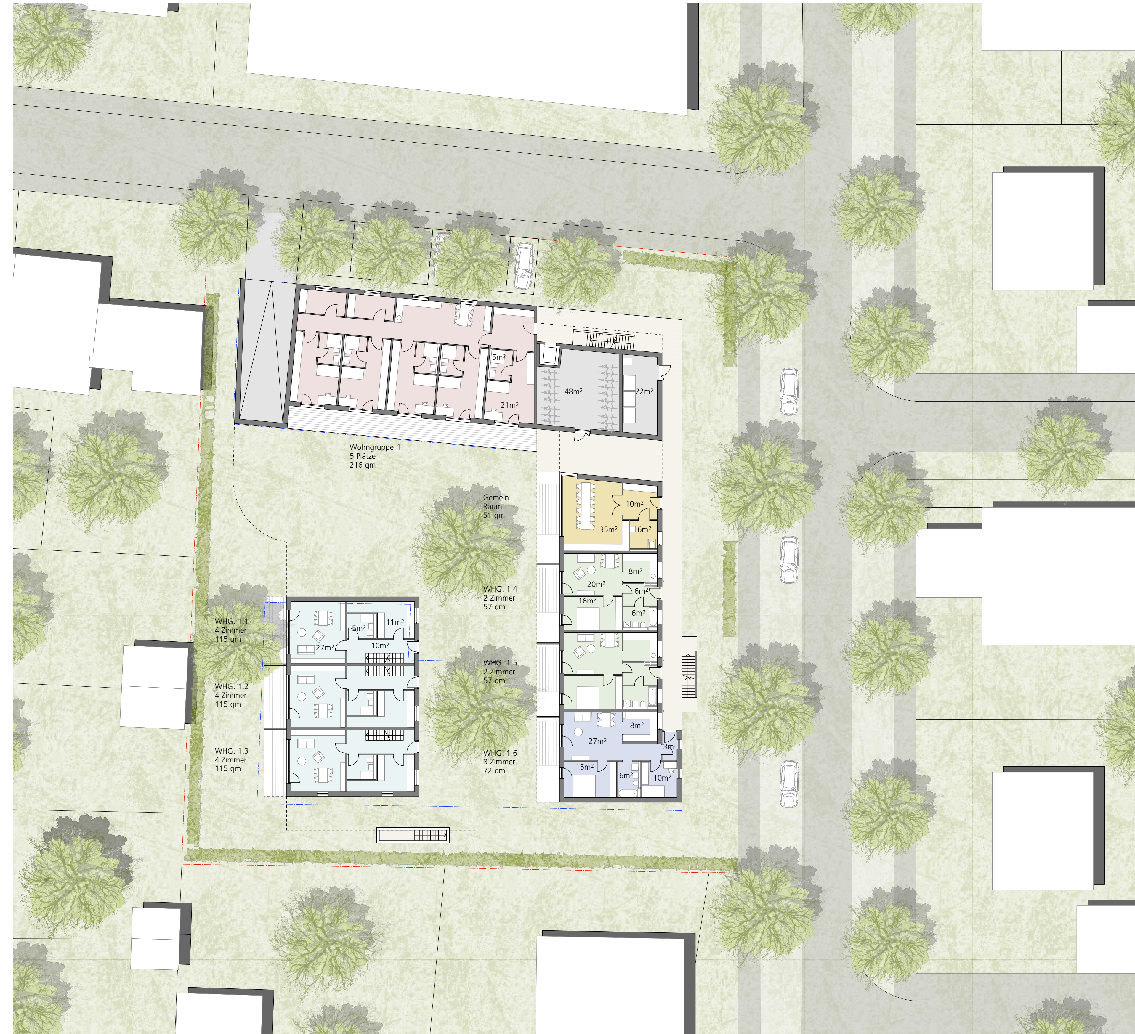
GRUNDRISS ERDGESCHOSS M 1:200